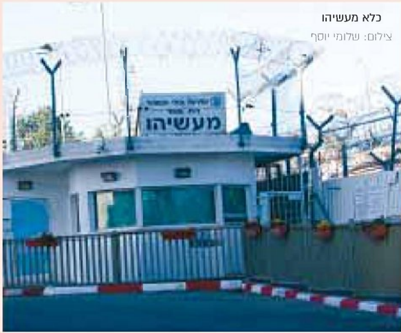
כלא מעשיה